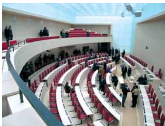
Bayerischer Landtag, München Bavarian Parliament, Munich

With GIFAfloor flooring systems you'll reach the highest level. In both meanings of the words. Load bearing capacity, fire protection behavior and last not least the flexibility of GIFAfloor raised access floors and hollow floors show the superiority to other products.