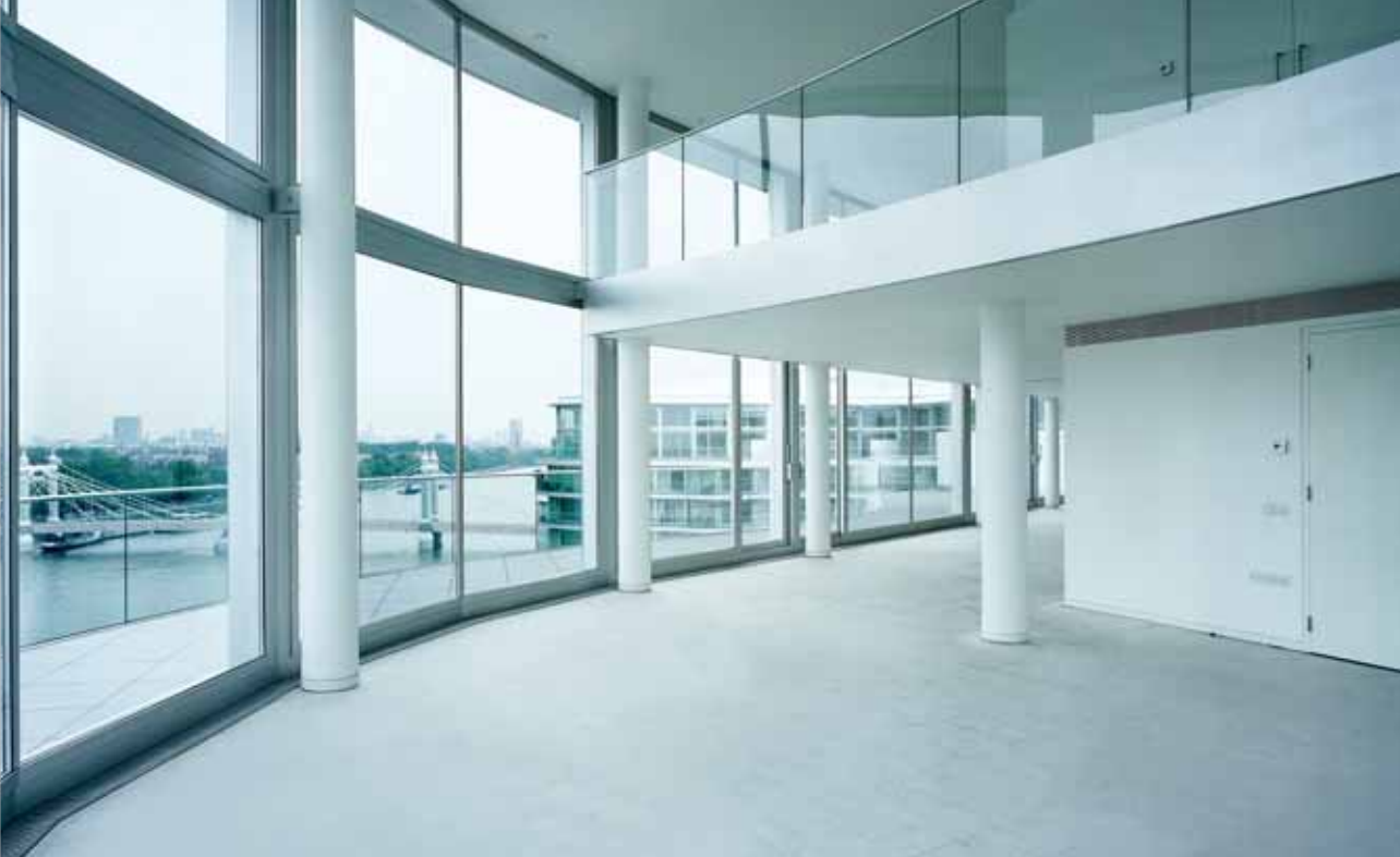
Albion Riverside, London